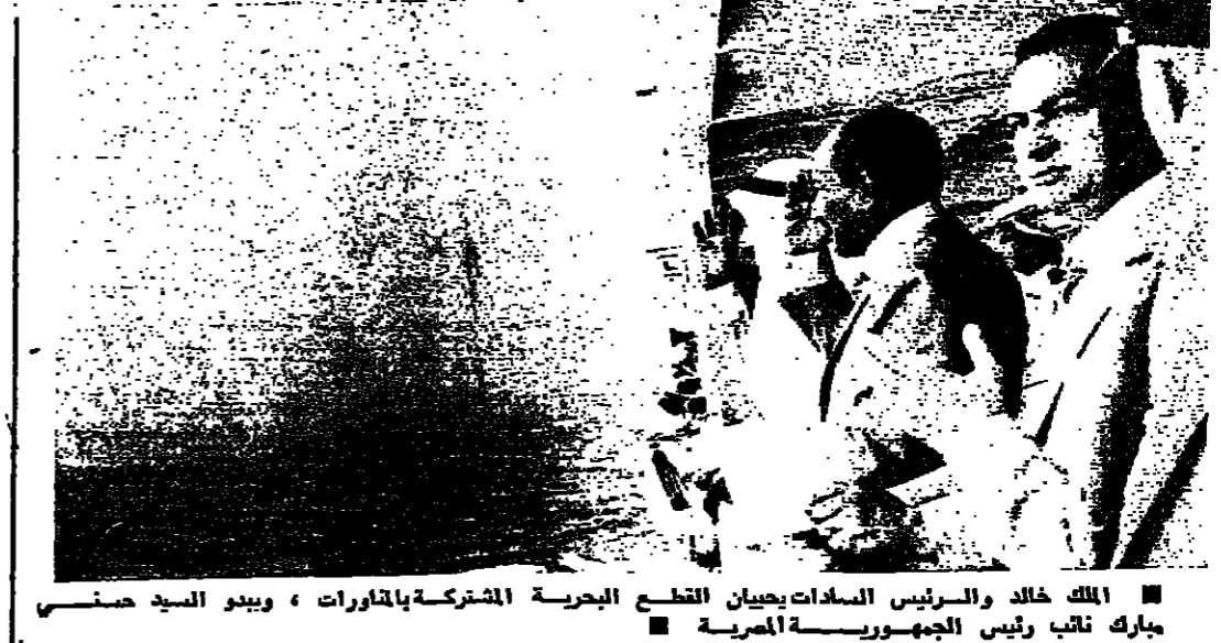
الملك خالد والسراييس السادات يفتحون القبع البحرية المشتركة بالمتاورات ، ويبدو السيد حسني مبارك نائب رئيس الجمهورية المصرية